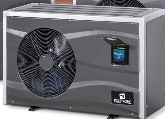
MASTER INVERTER XXS, XS, S a S+