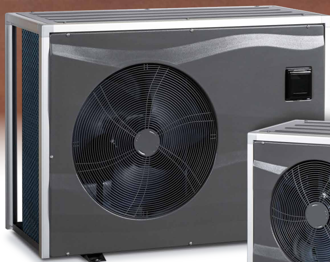
MASTER INVERTER L a L+