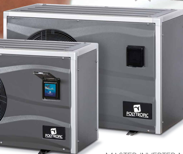
MASTER INVERTER M a XM